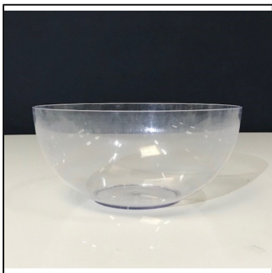
saladier translucide dia 30

Nous vous proposons à la vente du matériel de réception, de buffet, de traiteur, de catering... Tout l'équipement et le matériel de réception pour dresser vos buffets chauds ou froids. Découvrez l'indispensable saladier translucide !