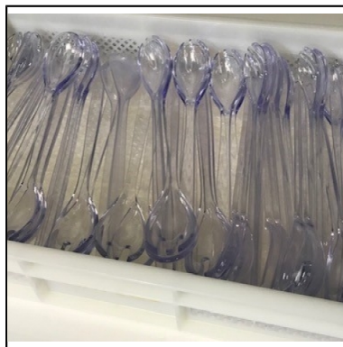
couverts salade translucide les 2